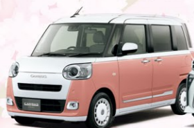
ムーヴキャンパス