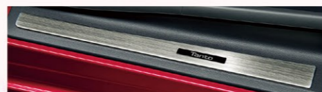
スカッフプレートカバー(フロント)